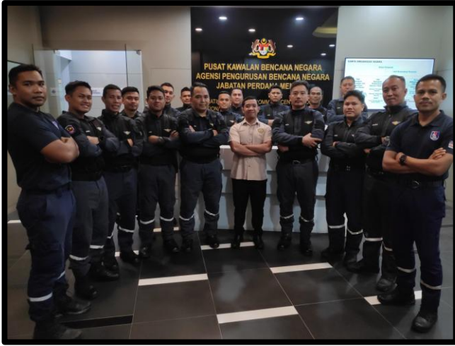
LAWATAN SEMPENA JOINT EXERCISE SMART DAN AIRPORT FIRE AND RESCUE SERVICE (AFRS)