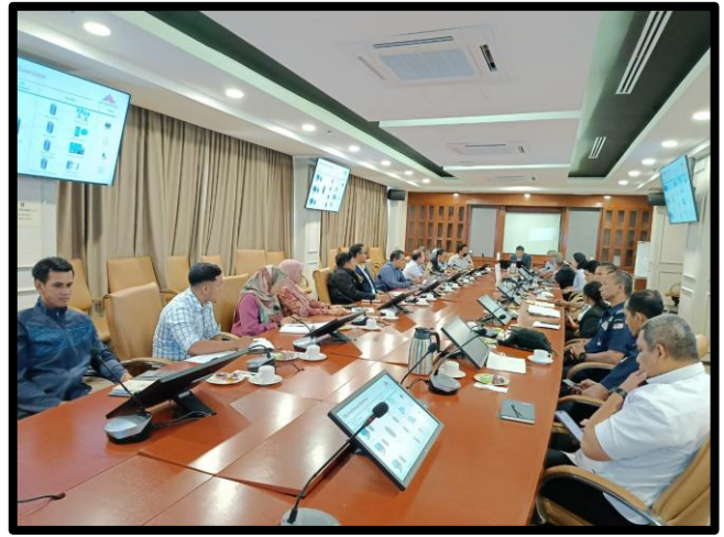
SESI PEMBENTANGAN / KEMASKINI TEKNOLOGI PROJEK CELL BROADCAST SYSTEM (CBS) UNTUK KEGUNAAN SEMASA BENCANA