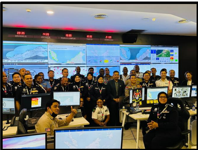
LAWATAN PESERTA KURSUS INTERNATIONAL SENIOR POLICE OFFICERS COMMAND COURSE (ISPOCC) KE-49