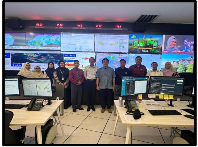
LAWATAN KERJA UNIVERSITI PENDIDIKAN SULTAN IDRIS (UPSI)