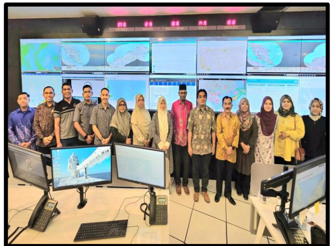
LAWATAN KERJA ENFORCEMENT, LEADERSHIP AND MANAGEMENT UNIVERSITY (ELMU)