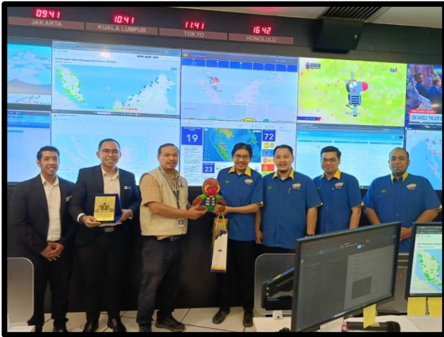
LAWATAN PENANDA ARAS PEJABAT SETIAUSAHA KERAJAAN NEGERI (SUK) NEGERI PERLIS